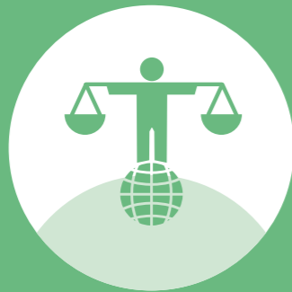
Klimaneutrale Müller Group

Wir nehmen unsere gesellschaftliche Verantwortung wahr.