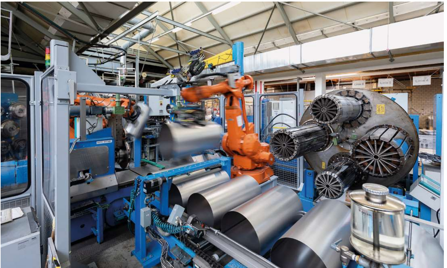
Fertigung von konischen Trommeln im Werk Münchenstein

Ein grosses Rohstofflager sichert die kontinuierliche Produktion ohne Versorgungslücken. Auch das macht Müller Packaging zum verlässlichen Partner.