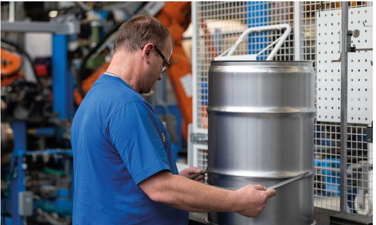
Qualitätskontrolle: In-Prozess-Kontrolle in der Linienfertigung